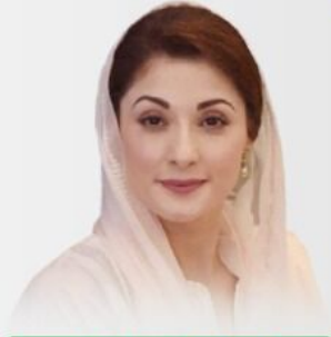
وزیر اعلیٰ پنجاب مریم نواز شریف